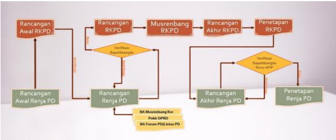
Gambar 1.1. Tahapan Penyusunan Renja